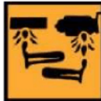
C - Corrosif