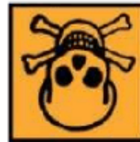
T - Toxique