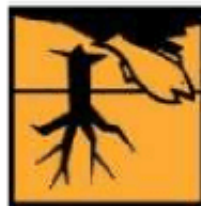
N - Dangereux pour l'environnement