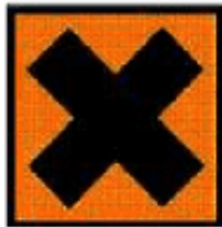
Xi - Irritant Xn - Nocif